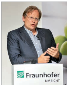
Prof. Dr. med. Dietrich Grönemeyer

»Genauso wie in der Medizin geht es mir darum, dabei zu helfen, dass auch komplexe Themen aus Wissenschaft und Technik für die Bevölkerung gut verständlich dargestellt werden. Dies ist ein wesentlicher Baustein auf dem Weg, den Nachwuchs für die Wissenschaft zu begeistern. Vor diesem Hintergrund begrüße ich es sehr, dass auch die publizistische Qualität und die damit verbundene Allgemeinverständlichkeit bei der Präsentation der Forschungsarbeiten maßgeblich in die Bewertungskriterien mit einfließen.«