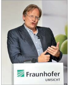
Prof. Dr. med. Dietrich Grönemeyer

»Genauso wie in der Medizin geht es mir darum, dabei zu helfen, dass auch komplexe Themen aus Wissenschaft und Technik für die Bevölkerung gut verständlich dargestellt werden. Dies ist ein wesentlicher Baustein auf dem Weg, den Nachwuchs für die Wissenschaft zu begeistern. Vor diesem Hintergrund begrüße ich es sehr, dass auch die publizistische Qualität und die damit verbundene Allgemeinverständlichkeit bei der Präsentation der Forschungsarbeiten maßgeblich in die Bewertungskriterien mit einfließen.«