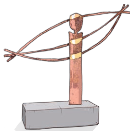
Skulptur exklusiv für den UMSICHT-Wissenschaftspreis von Hans-Dieter Godölt entworfen.