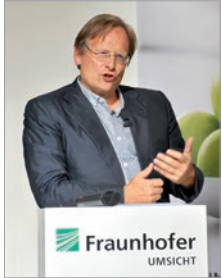
Prof. Dr. med. Dietrich Grönemeyer

»Genauso wie in der Medizin geht es mir darum, dabei zu helfen, dass auch komplexe Themen aus Wissenschaft und Technik für die Bevölkerung gut verständlich dargestellt werden. Dies ist ein wesentlicher Baustein auf dem Weg, den Nachwuchs für die Wissenschaft zu begeistern. Vor diesem Hintergrund begrüße ich es sehr, dass auch die publizistische Qualität und die damit verbundene Allgemeinverständlichkeit bei der Präsentation der Forschungsarbeiten maßgeblich in die Bewertungskriterien mit einfließen.«