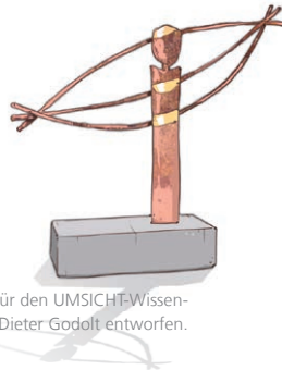
Skulptur exklusiv für den UMSICHT-Wissenschaftspreis von Hans-Dieter Godolt entworfen.