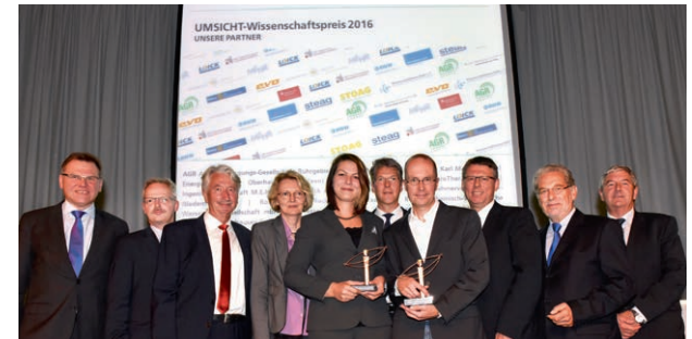
Preisträger, Jury und Unterstützer des UMSICHT-Wissenschaftspreises 2016.